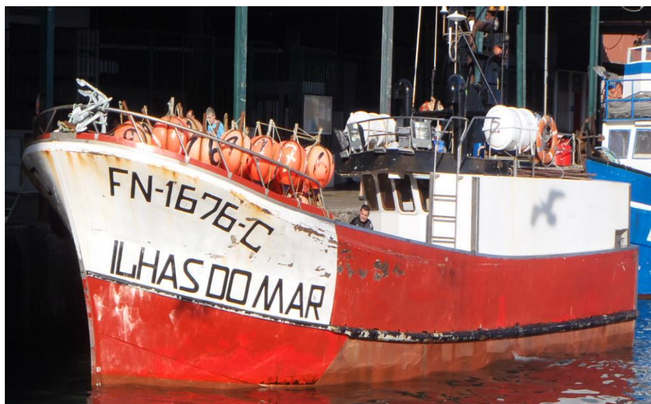
Figura 2 – Embarcação Ilhas do Mar, FN-1675-C.

Os meios de esgoto a bordo da embarcação não foram os suficientes para esgotar a entrada de água pelo que a tripulação abandonou a embarcação e embarcou nas balsa salva-vidas, onde aguardou pelo resgate.