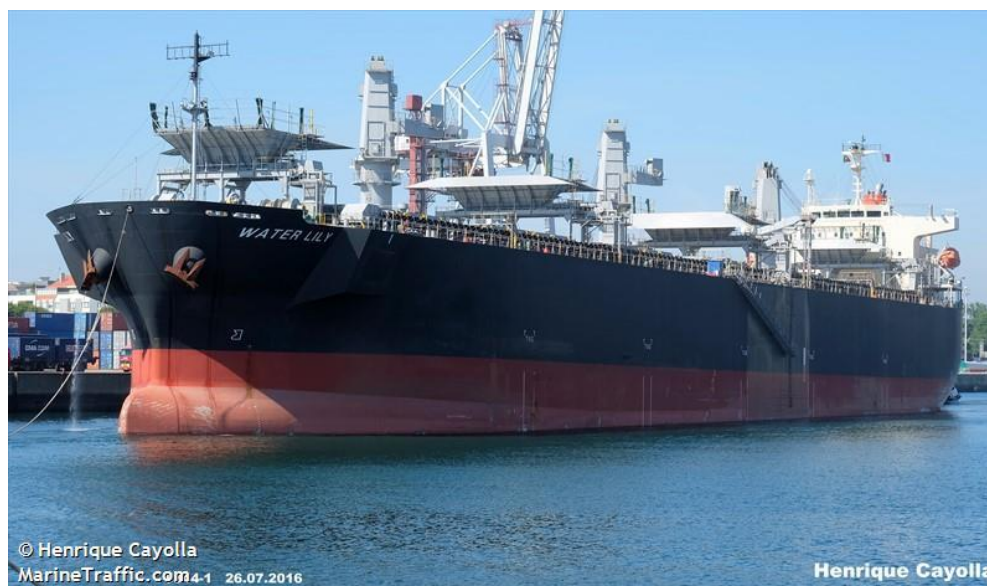
Figura 3 – Navio Water Lily, IMO 9608221, bandeira Panamiana.

O GAMA iniciou uma investigação técnica de segurança, conforme previsto na Lei n.º 18/2012, de 07 de maio, com o objetivo de apurar as causas que estiveram na origem do acidente e, através das conclusões e de possíveis recomendações de segurança, prevenir que acidentes semelhantes ocorram.